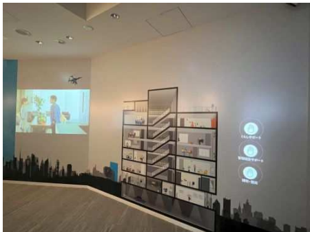
インタラクティブウォール

センサーのある7カ所のタッチポイントに手をかざすと、快適な暮らしをサポートする管理会社の機能などについて約20～30秒のアニメーションが表示されます。また、マンション管理の未来などをイメージ映像でご紹介します。