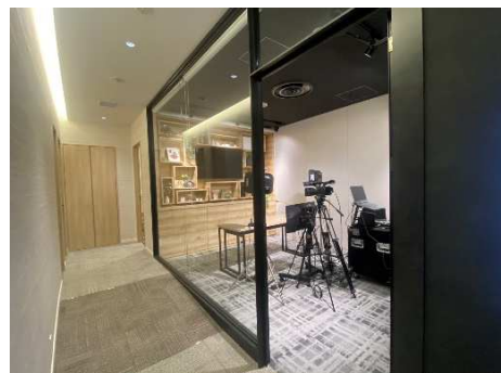
ガラス張りで開放感のある設計