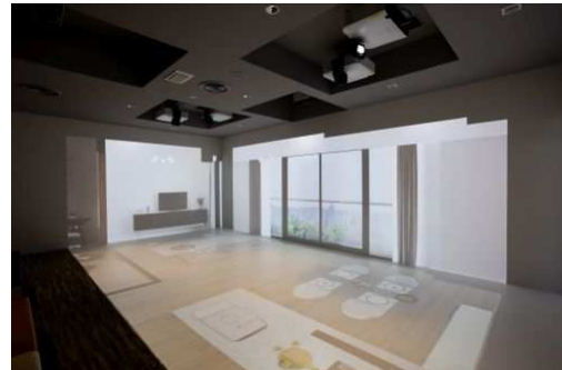
住戸の内部を体感できるVRモデルルーム