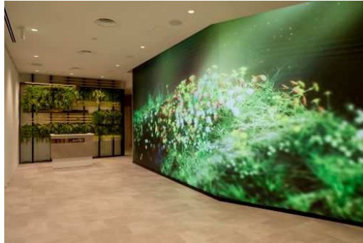
エントランスのウェルカムムービー

巨大 LED パネルを設置し、ウェルカムムービーを表示します。洗練された空間や上質な時間を過ごせる期待感を醸成し「DAIKYO LIFESTYLE STUDIO」へ誘います。