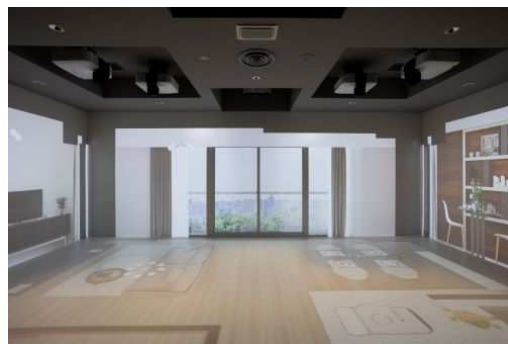
シアタールームに投影されるVRモデルルーム

本施設では、大京およびそのグループ会社が提供する住まいに関するトータルサービスについて、お客さまやお取引先などの皆さまに体感いただけます。大京のものづくりに対する想いや目指す未来を表現したムービーをシアターで投影するほか、実物大のお部屋を体感いただけるVRモデルルームや大京の歴史を展示したコーナーなどを設置しています。また、壁面の絵に手をかざすとセンサーが反応し、マンションの管理機能などをアニメーションで紹介するインタラクティブウォールなど、楽しみながら住まいに関する各社のサービスを体感することができます。