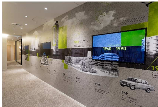
三つの年代別でトピックスをご紹介します

1968年に分譲されたシリーズ第一号物件「ライオンズマンション赤坂」から、2023年竣工の大規模複合開発「ライオンズタワー札幌」まで、大京が歩んできた歴史や物件など数々のトピックスをご紹介します。