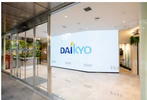
エントランスでのウェルカムムービー

株式会社大京（本社：東京都渋谷区、社長：深谷 敏成）は、東京都渋谷区の本社1階に、大京およびそのグループ会社*が提供する上質な住まいや暮らしのサービスを、映像やパネル展示などを用いて体感できる情報発信拠点「DAIKYO LIFESTYLE STUDIO」（大京ライフスタイルスタジオ）を2023年10月23日（月）に開設しますのでお知らせします。