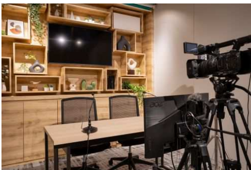
ウェビナースタジオ

販売物件のオンライン説明会やお客さま向けセミナーなどの配信を行います。柔らかく温かな風合いを持つ木目調の家具を背面に設置した、開放感のある明るいスタジオです。