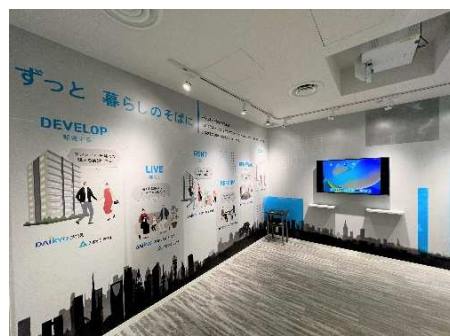
グループ会社紹介

マンション購入後の「貸す・借りる」「リフォーム」「売る」など、さまざまな場面でお客さまをサポートする、大京およびそのグループ会社についてご紹介します。大京アステージの「POCKET HOME」や穴吹工務店の「顔認証セキュリティサービス F-face」、大京穴吹不動産の「バーチャルステージングサービス」など各社サービスをモニター上で展示します。今後の新サービスも順次ご紹介する予定です。