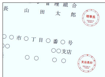
契約の手続き（イメージ）

当社と管理委託契約を結ぶ管理組合向けに、本サービスを無料でご提供します。管理組合と管理会社の間では、管理委託契約書以外にも各種修繕工事の注文書・請書や総会議事録など、年間を通して20種類程の書面を交付しています。本サービスでは、当初は管理委託契約書の電子化を行い、今後他の書面にも対象を拡大する予定です。